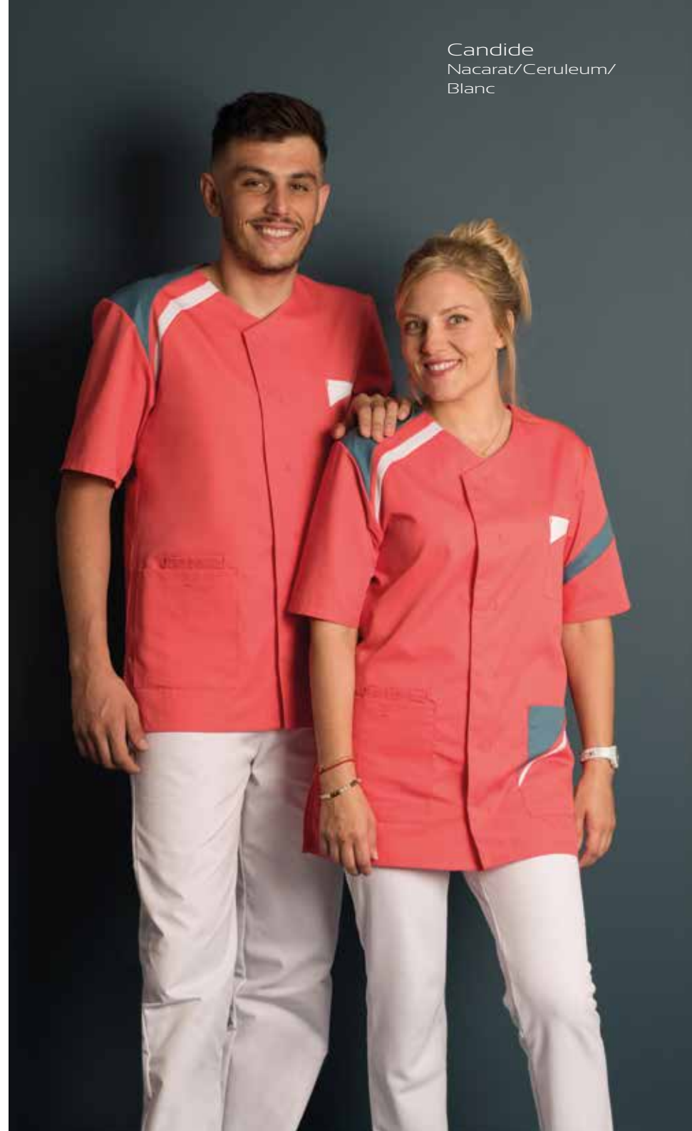
Candide Nacarat/Ceruleum/ Blanc