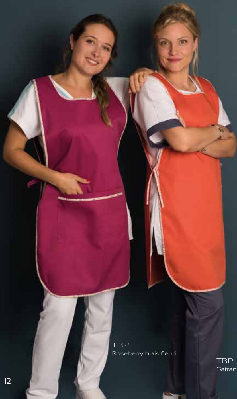
TBP Roseberry biais fleuri